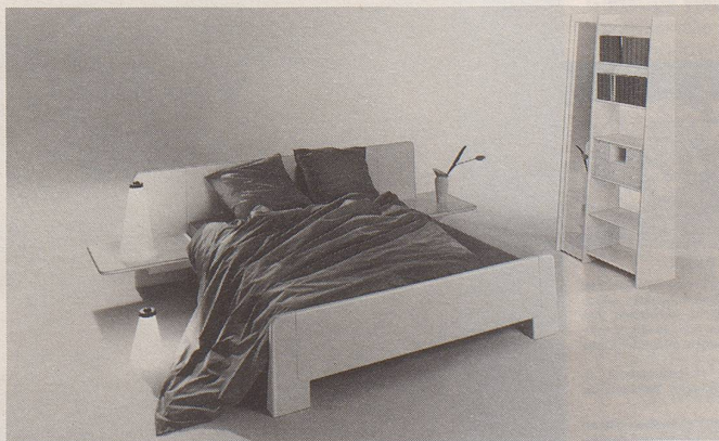
Ein Kombinationsbeispiel aus dem ultra-Programm von Victoria. Lassen Sie sich kostenlos die umfassende Dokumentation über Ausführung, Masse und Preise zusenden!

Aber ich sehe schon, schliesslich werde ich wohl dort, wo man es ja wissen muss, anfragen müssen, nämlich im Konservatorium. Ob die Professoren mir wohl Auskunft geben können? Oder wissen es die, welche die neue Musikart erfunden haben?