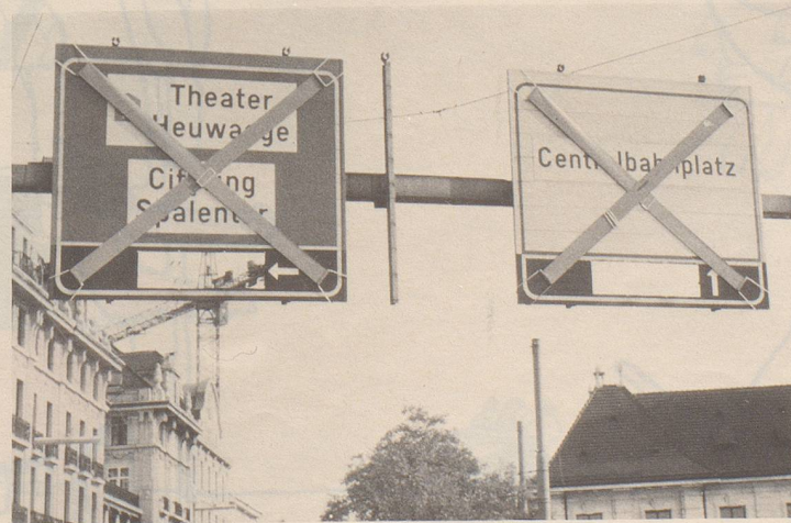
(In Basel beobachtet von pin)