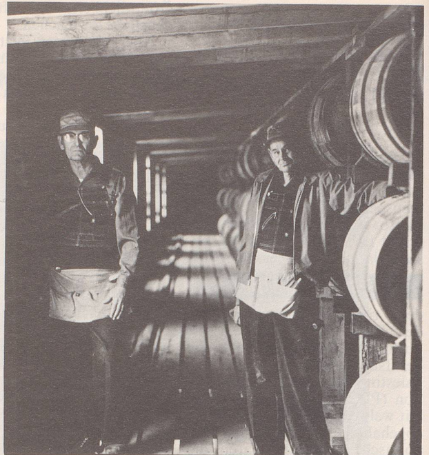
If you would like a booklet about Jack Daniel's Whiskey, write us to Lynchburg, Tennessee 37352, USA

Senkrecht: 1 Bonus, 2 Auskunft, 3 Ares, 4 Rallye, 5 Rio, 6 mia, 7 Dame, 8 me, 9 Sinus, 10 ge, 11 Mir, 12 anfangs, 13 BE, 14 Lola, 15 Straus, 16 Pa, 17 Patin, 18 Els, 19 Mango, 20 itt, 21 Arie, 22 Motte, 23 Eva, 24 Ah, 25 bedeutet, 26 NW, 27 Spengler, 28 Rialto, 29 Epik, 30 on, 31 Menge, 32 net, 33 es, 34 Haile (Selassie), 35 WT, 36 il, 37 RL, 38 Linda, 39 lau, 40 Historie, 41 Tenn, 42 Projekte, 43 Drang.