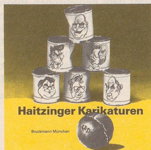
Horst Haitzinger Haitzinger Karikaturen 85 72 Seiten, gebunden, Fr. 15.80