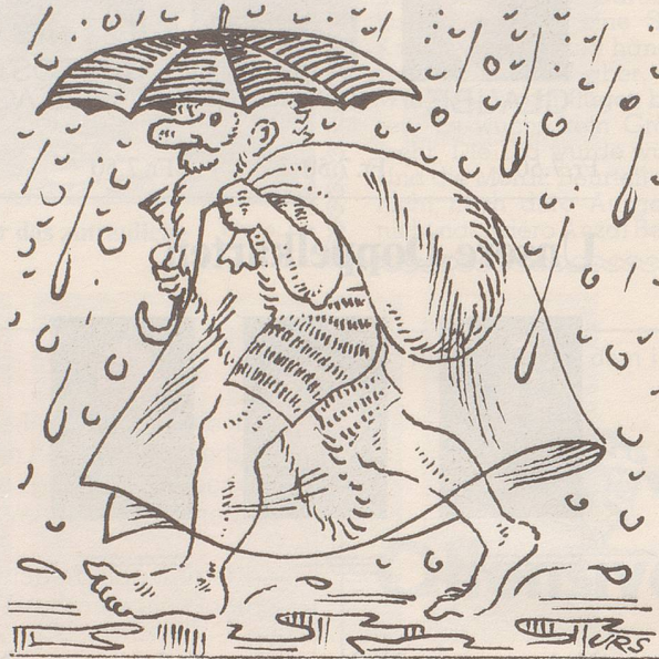
Klimaverschiebung? Problem gelöst!

Vielleicht habe ich eine Möglichkeit, Ihnen zu sagen, wann das Buch ganz fertig ist, wo Sie es bekommen können und was es kostet.