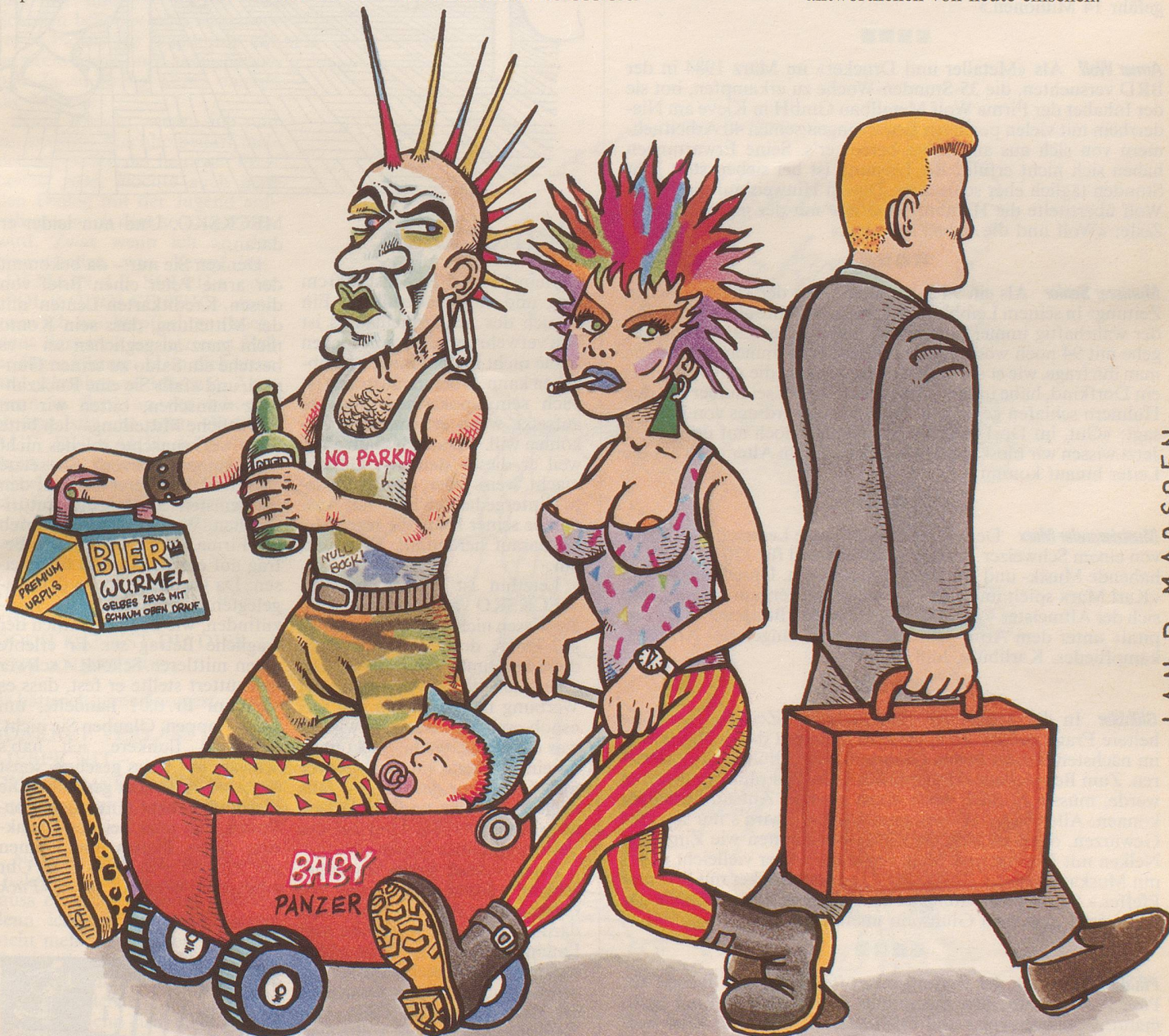
«Einfach schockierend, diese jungen Leute ...»

Ob das Jahr 1985 bei der Jugend lediglich ein Ohnmachtsgefühl hinterlassen wird? So lange die Jugendlichen nur als Konsumenten ernst genommen werden, ganz bestimmt. Dass aber ihre Generation bezüglich der Umwelt von morgen berechnete Forderungen vertritt, müssten eigentlich die Verantwortlichen von heute einsehen.