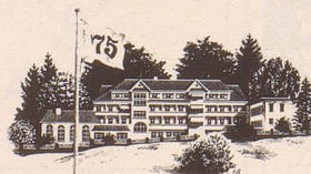
****Eden Rheinfelden, Hotel und Solbad 4310 Rheinfelden, Tel. 061/87 54 04

Das Haus mit der persönlichen Ambiance und Betreuung, dem geheizten Sole-Aussen- und Hallen- bad, dem grossen Park und dem Kurarzt und aller Therapie im Haus.