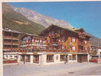
Hotel Bergheimat ★★