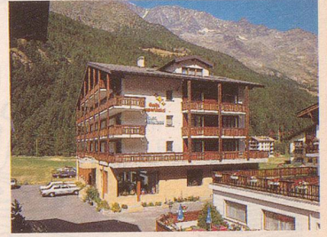
Aparthôtel étoile ★★★

bei der Talstation der Gondelbahn Saas-Grund – Kreuzboden – Hohsaas.