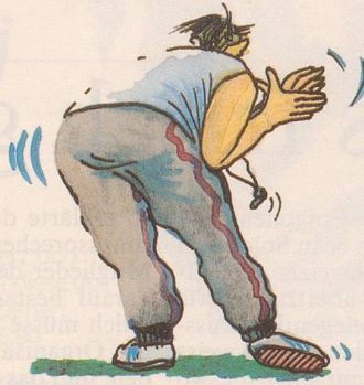
... 4 und ...