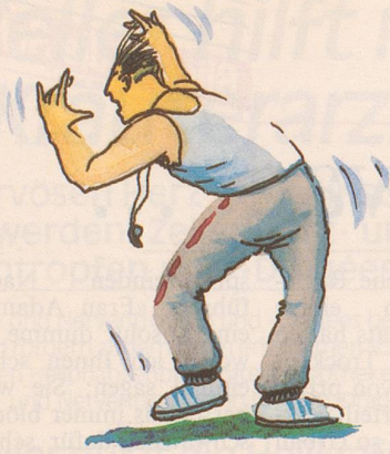
«2 und ...