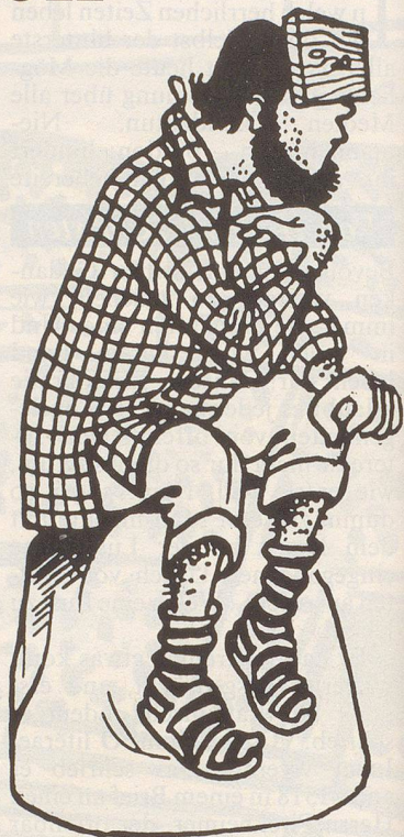
Diese Skizze von Georges Mousson vermag eine Ahnung davon zu vermitteln, wie gefällig ein Denkmal wäre in Anlehnung an Rodins «Denker». Um dem Werk trotz unbestreitbarer Modernität einen Hauch historischer Ambiente zu verleihen, würde eine verbreitete Kleidermode der frühen fünfziger Jahre gewählt.

Dasselbe auch mit dem Tell machen zu wollen – sanfte Renovation, um im Jargon der Denkmalpflege zu reden –, das hätte man bis vor kurzem noch erwägen können. Doch seine denkmalpflegerische Erneuerung wurde erschwert durch die jüngste erschütternde Kunde eines Historikers, zu Lebzeiten Tells (falls er gelebt hätte) sei hierzulande die Armbrust noch unbekannt gewesen. Das hat uns nun wirklich gerade noch gefehlt! Und selbst wenn besagte Kunde sogleich einen anderen Historiker auf den publizistischen Plan rief, der die Existenz dieser Schusswaffe im Gebiet von Uri der neunziger Jahre des 13. Jahrhunderts für möglich, ja sogar wahrscheinlich hält, so hat die leidige Kontroverse doch die Armbrust völlig suspekt und dafür untauglich gemacht, fürderhin als Accessoir unseres Nationalhelden zu dienen. Das ist schade, fürwahr, denn gerade in jüngster Zeit war die Armbrust im Begriff, neue patriotische Werte zu erwerben und an Bedeutung zu gewinnen: Angesichts des Kessel-treibens mancher Kreise gegen den Schiesslärm hätte Tell zum überragenden Promotor einer Substitution des Schiessgewehrs durch die umweltfreundlichere weil geräuschärmere Armbrust werden können.