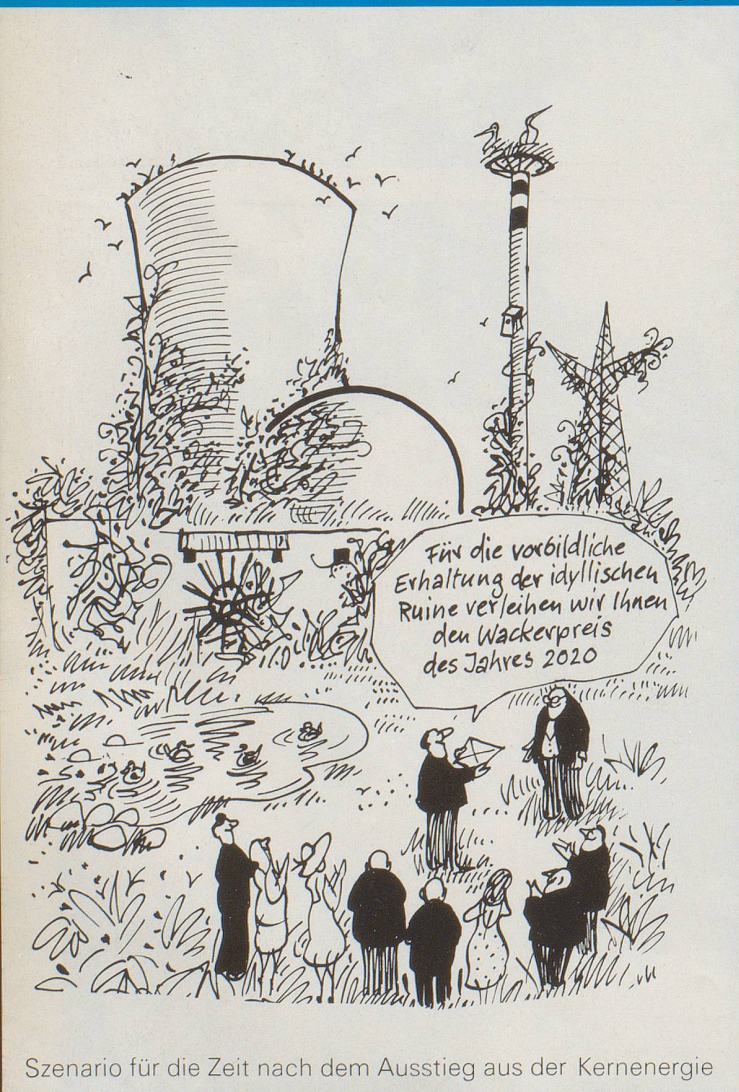
Szenario für die Zeit nach dem Ausstieg aus der Kernenergie