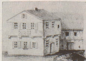
Schillers Geburtshaus in Marbach

In dieser prachtvollen 7bändigen Ausgabe finden Sie Schillers berühmteste Werke: eine ungekürzte Auswahl aus der sogenannten «Kleinen Stuttgarter Schillerausgabe der Cottaschen Hofbuchhandlung». Alle 7 Bände komplett zu einem phantastischen Preis: nur