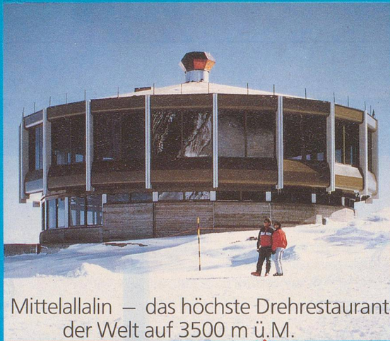
Mittelallalin – das höchste Drehrestaurant der Welt auf 3500 m ü.M.