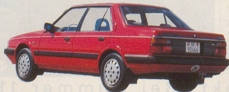
Den Mazda 626 gibt's in zwei Versionen: 5-türig wie im grossen Bild und 4-türig wie im kleinen.