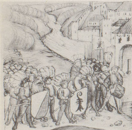
In der Urgeschichte der zürcherisch-baslerischen Beziehungen herrschte nicht nur Totschlag und Brandstiftung, sondern gelegentlich auch freundschaftlich rosiger Friede. So besuchte anno 1504, drei Jahre nach Basels Eintritt in den Bund der Eidgenossen, eine hochoffizielle Zürcher Deputation die Basler Fasnacht, allwo sie, wie Gerold Edlibachs Helgen aus der Zürcher Chronik beweist, freundlich mit Trommeln und Piccolos empfangen wurden.