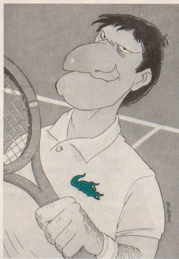
Aus dem Buch «Fièvre de printemps» von Michel Bridenne, erschienen bei Editions J. Glénat

Hier, auf der Brust, entscheidet es sich, wer ein marginaler Garnichts ist, weil er ein ebensolches auf der Brust trägt; ein Buchstabe degradiert brave Menschen zum Warenhaussopper, zum Banansen, zum modischen Tiefflieger, ja Inexistenten, und dies, weil er es wagt, ein Polo zu tragen, das