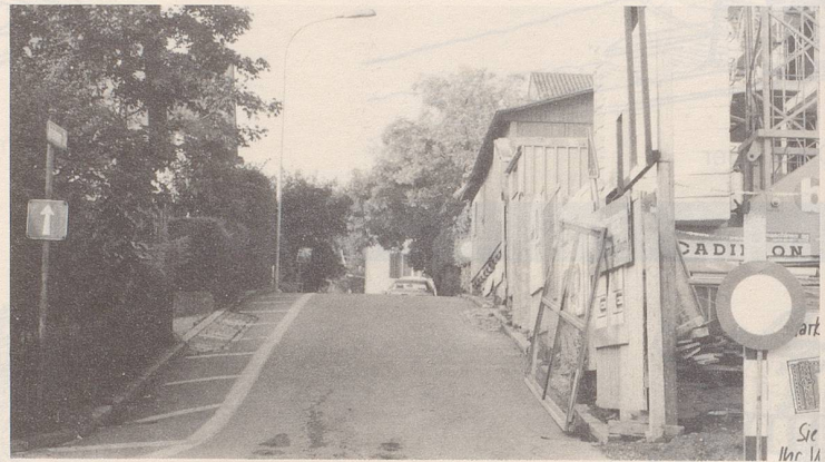
Eine Übungsstrecke für Geisterfahrer?