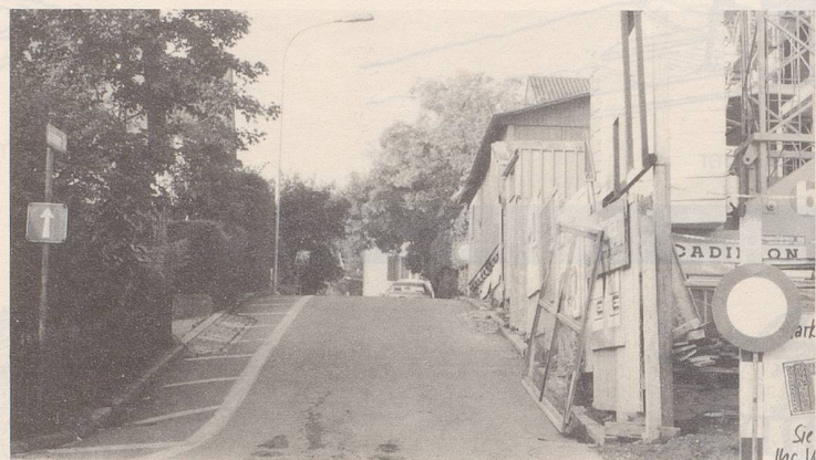
Eine Übungsstrecke für Geisterfahrer?