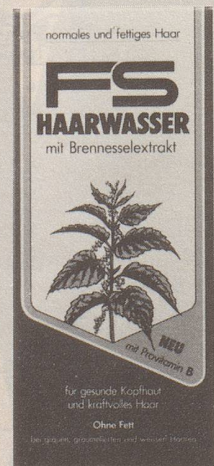
für normales und fettiges Haar

FS – das Haarwasser mit Brennesselextrakt.