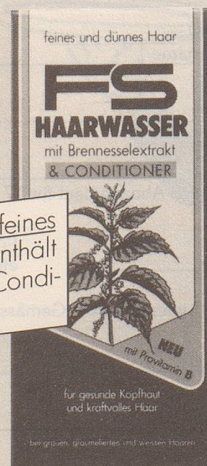
für feines und dünnes Haar

NEU: FS Haarwasser für feines und dünnes Haar enthält zusätzlich einen haarpflegenden Conditioner für mehr Halt und Fülle.