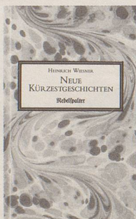
Heinrich Wiesner NEUE KÜRZESTGESCHICHTEN mit Scherenschnitten von Martin Mächler Fr. 14.80

«Diese Geschichten, formal orientiert an der angelsächsischen short story, sind wohl auch deshalb so alltäglich, weil sich der Leser darin, wenn auch oft überraschend, wiederzuerkennen vermag» Appenzeller Zeitung