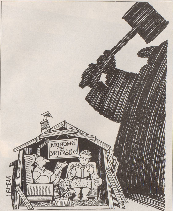
«Was meinst du, Emmi, was macht die Gesetzgebung aus dem Mieterschutz -?»