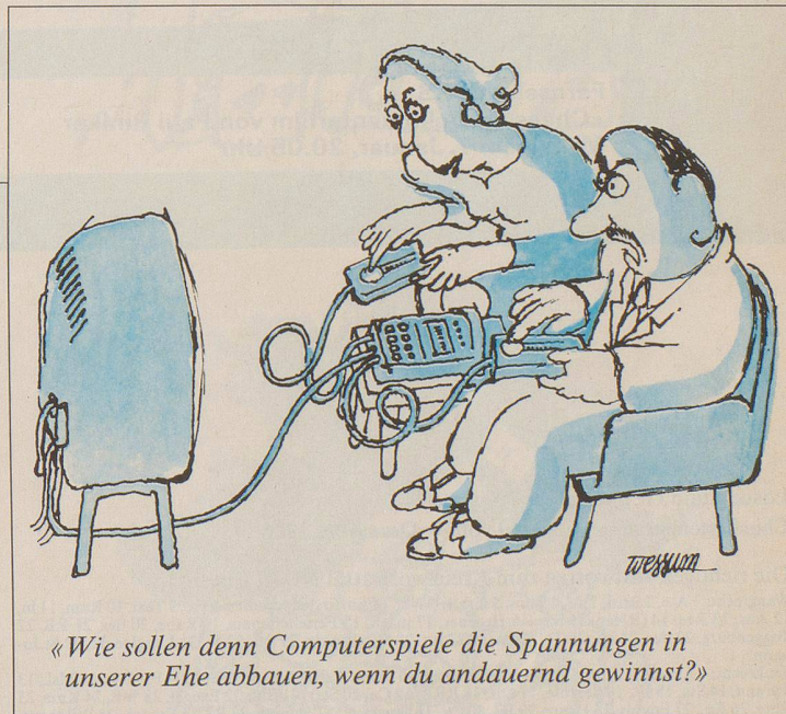
«Wie sollen denn Computerspiele die Spannungen in unserer Ehe abbauen, wenn du andauernd gewinnst?»