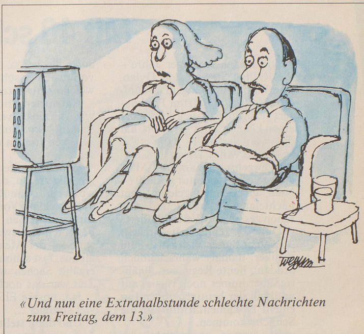
«Und nun eine Extrahalb Stunde schlechte Nachrichten zum Freitag, dem 13.»