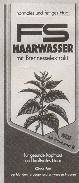
für normales und fettiges Haar.

NEU: FS Haarwasser für feines und dünnes Haar enthält zusätzlich einen haarpflegenden Conditioner für mehr Halt und Fülle.