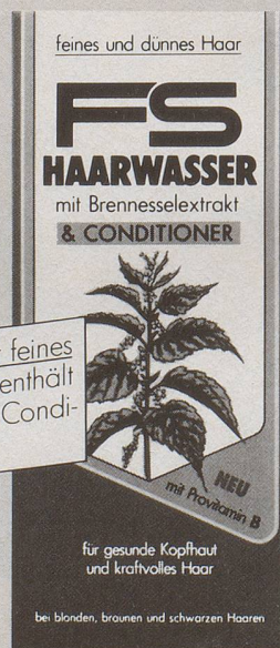
für feines und dünnes Haar.

Regelmässig jeden Morgen angewendet, wird das gesunde Wachstum der Haare gefördert, die Kopfhaut bleibt schuppenfrei und Mangelerscheinungen wird wirksam vorgebeugt. Das Haar wird kraftvoller, besser frisierbar und erhält einen gesunden, gepflegten Glanz.