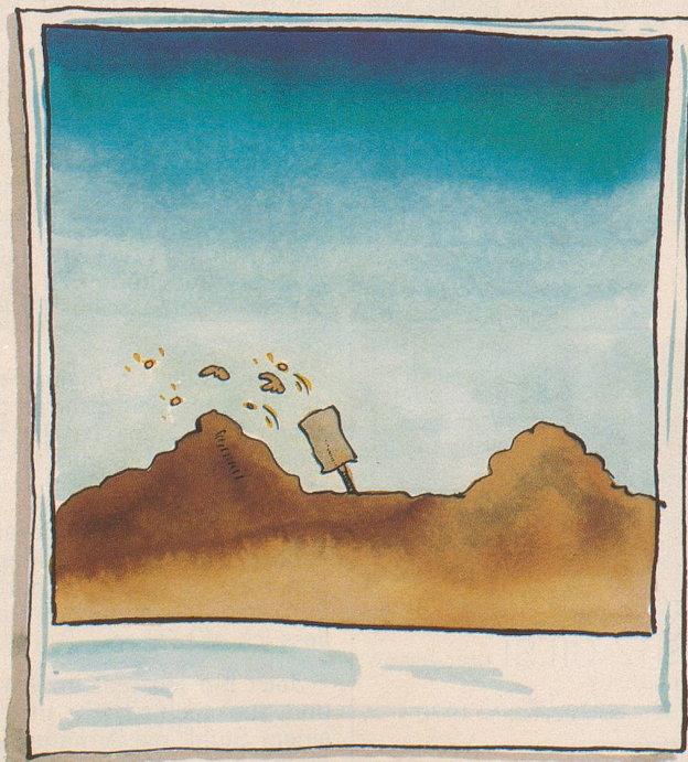
Pirmin Zurbruggen, Ski-Weltmeister, schon wieder am Goldschürfen, diesmal in den Anden.