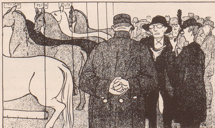
Im Pferdefall: «Ziber – äh – sagen Sie, wo find denn nun hier die – äh – grünen Pferde?»

Idee zur Landesausstellung 1883 in Zürich ( Nebelspalter Nr. 31/1883)