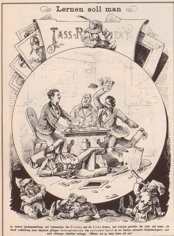
an unserer Landesausstellung und insbesondere den Frieden und die Liebe fördern, wodurch geschähe das mehr und besser, als durch Aufstellung eines allgemein gültigen Jassreglements . Das nationale Spiel ist ein Zeichen nationaler Selbständigkeit; also wird «Hebung» derselben verlangt. «Heben» wir es, dann heben wir uns!