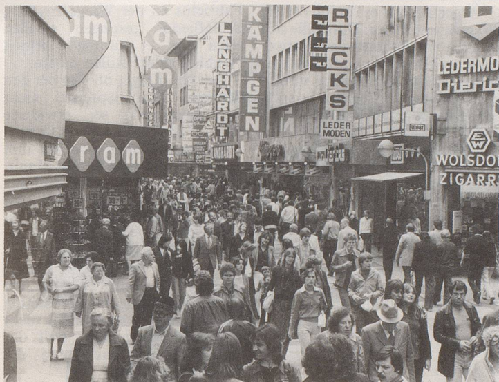
3 Die Prozessionen der Überbeschäftigten und Stressgeplagten ...