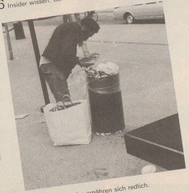
8 Und die Yuppies ernähren sich redlich.