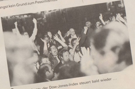
6 Insider wissen: der Dow-Jones-Index steuert bald wieder ...