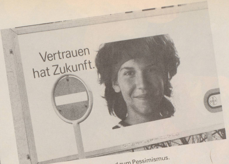
3 ... ist das noch längst kein Grund zum Pessimismus.