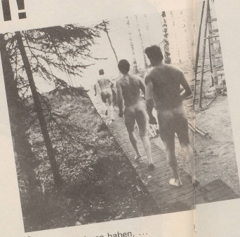
2 ... alles verloren haben, ...