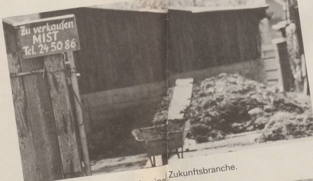
5 ... investieren Sie mutig in einer Zukunftsbranche.