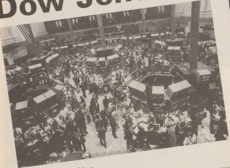
1 Wenn Sie an der Börse ...