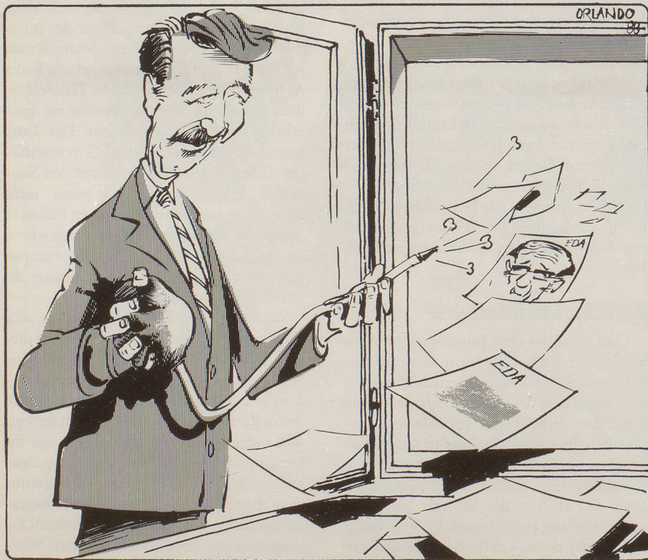
Mit starker Hand und frischem Wind