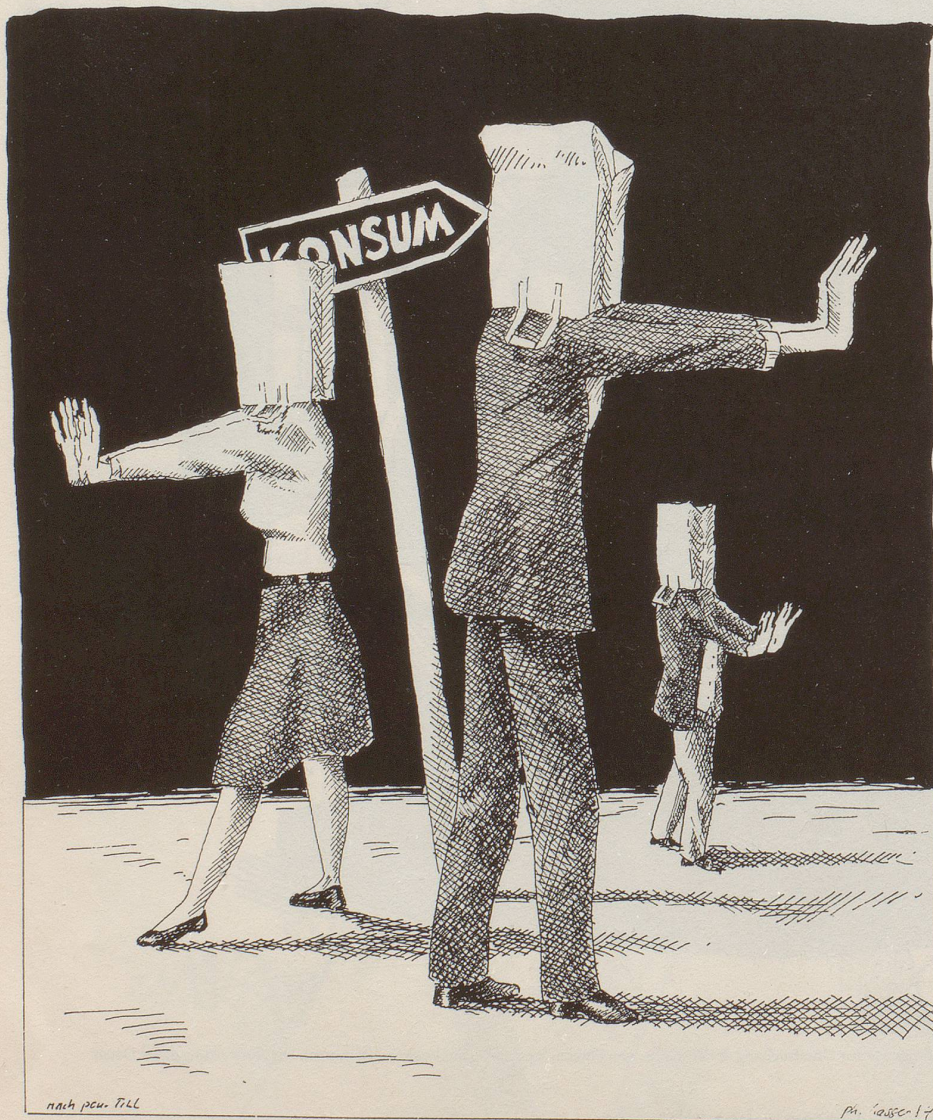
Auf der Suche nach dem Glück ...