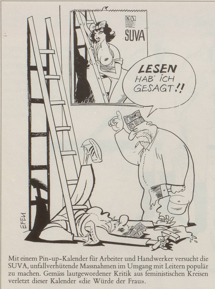
Mit einem Pin-up-Kalender für Arbeiter und Handwerker versucht die SUVA, unfallverhütende Massnahmen im Umgang mit Leitern populär zu machen. Gemäss lautgewordener Kritik aus feministischen Kreisen verletzt dieser Kalender «die Würde der Frau».