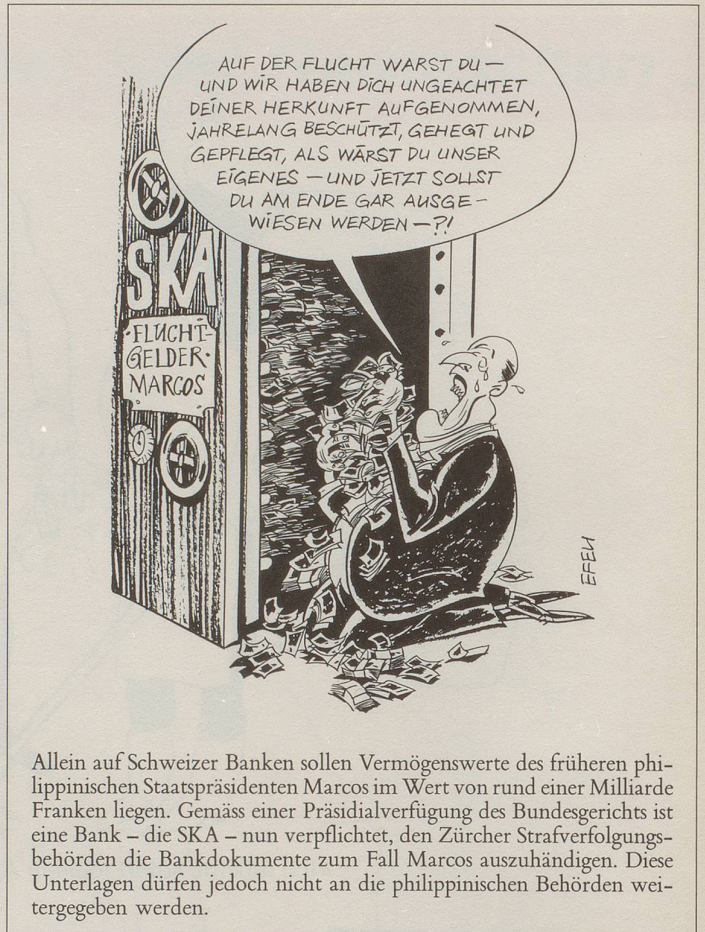
Allein auf Schweizer Banken sollen Vermögenswerte des früheren philippinischen Staatspräsidenten Marcos im Wert von rund einer Milliarde Franken liegen. Gemäss einer Präsidialverfügung des Bundesgerichts ist eine Bank – die SKA – nun verpflichtet, den Zürcher Strafverfolgungsbehörden die Bankdokumente zum Fall Marcos auszuhändigen. Diese Unterlagen dürfen jedoch nicht an die philippinischen Behörden weitergegeben werden.