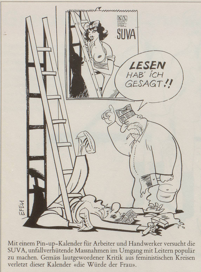
Mit einem Pin-up-Kalender für Arbeiter und Handwerker versucht die SUVA, unfallverhütende Massnahmen im Umgang mit Leitern populär zu machen. Gemäss lautgewordener Kritik aus feministischen Kreisen verletzt dieser Kalender «die Würde der Frau».