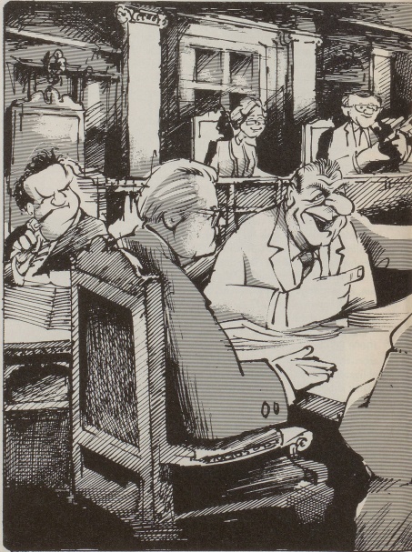
Richtiger 24. 1988

Genau, so kam es denn, aus Gründen der Staatsraison, dass der Bundesrat zur Überzeugung gelangte, er müsse sich die Vorbereitung der Festivitäten unbedingt nicht bloss 180'000, sondern im Gegenteil 200'000 Franken kosten lassen. Ein bravouröser Bundesrat, der vor der Geschichte als vaterländisch gelten wird. Und das Tupfchen auf i: Solari darf im Tessin Verkehrsdirektor bleiben!