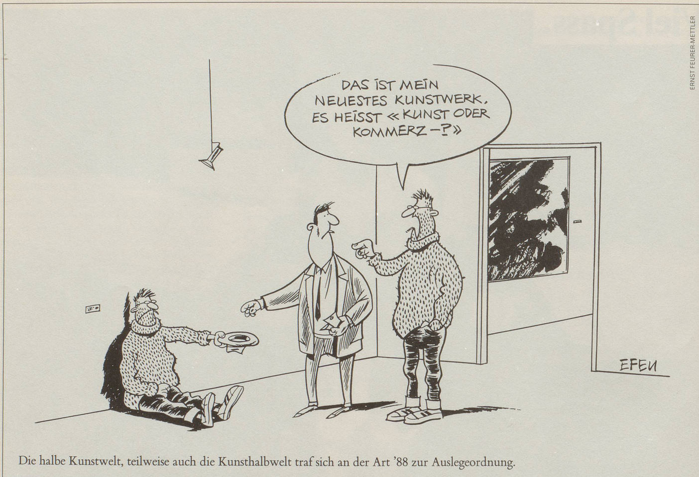
Die halbe Kunstwelt, teilweise auch die Kunsthalbwelt traf sich an der Art '88 zur Auslegeordnung.