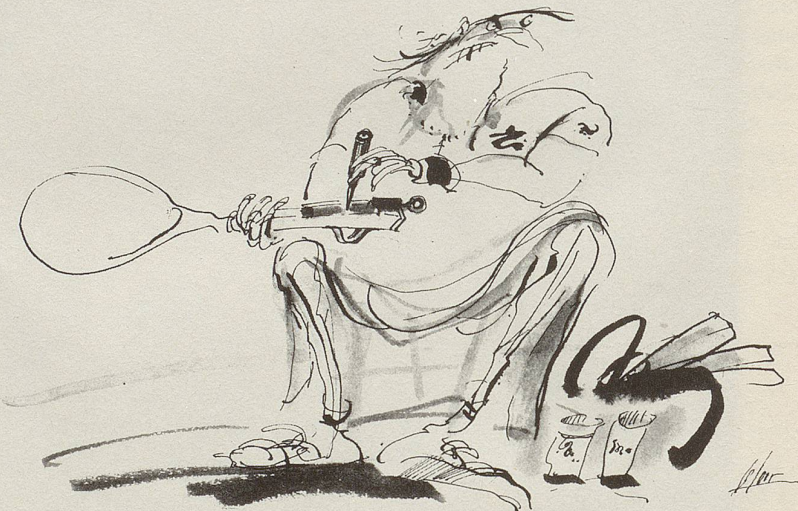
Vor dem tie-break