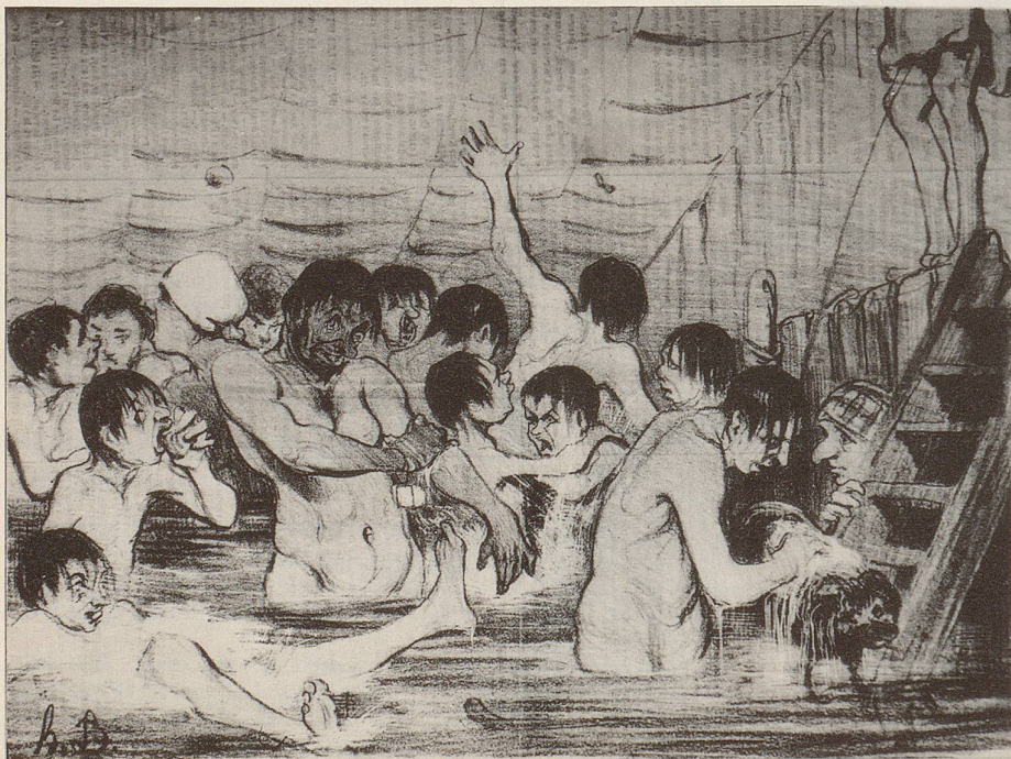
Massenbaden in Paris um 1850

Nachdem in Paris die Pferderennen en vogue kamen, fand er auch dort seine Opfer, wie er sie überhaupt beim sportlichen Geschehen gerne zu suchen pflegte. Oft dienten ihm freilich sportliche Szenen und Leistungen nur als Kulisse für politische Zeitglossen, etwa wenn er politische Gegner miteinander ringen oder boxen lässt, einem Schwerathleten er alle Steuerlast aufbürdet, führt Napoleon III. aufs Glatteis führt und ihn dabei zu Fall kommen lässt. Darüber