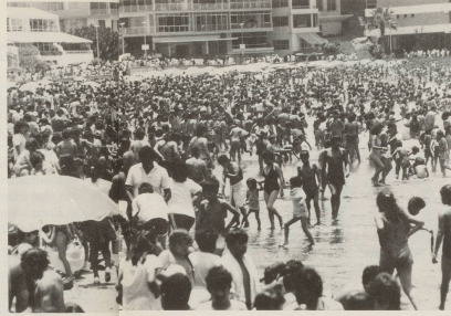
2 ... in Acapulco gelandet.