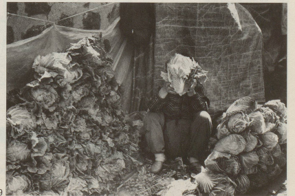
9 Das Wertvollste an unserer Weltreise sind jedoch die völkerverbindenden, menschlichen Begegnungen.