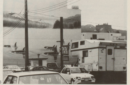
6 In der Wildnis Alaskas bewundern wir ...