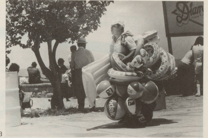
3 Täglich geht Fritz zum Schwimmen, während ich ...