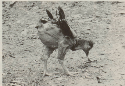
7 ... die reiche Vogelwelt, ...