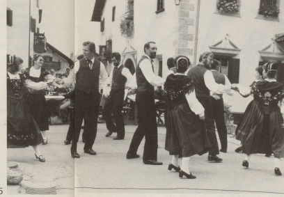
5 Der absolute Höhepunkt ist der 1. August in New Glarus.