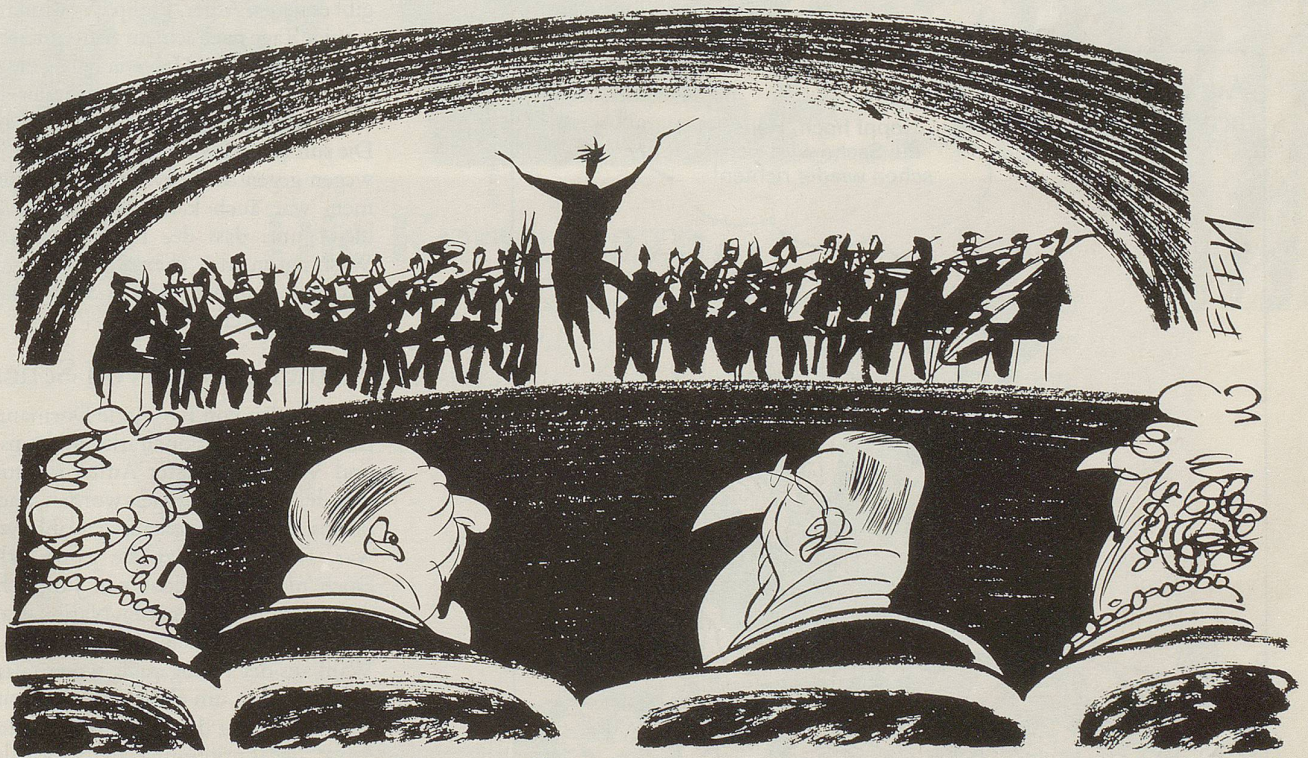
Musikfestwochen in Luzern: Wo sich Kunst- und Geschäftsleben finden ...

« WIR HABEN UNSEREN UMSATZ presto tempo VERBESSERT UND SUCHEN NUN pianissimo NEUE ANLAGEMÖGLICHKEITEN »