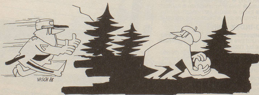
Dramatische Episode in einem Schweizer Wintersportort: «Haltet den Dieb!»