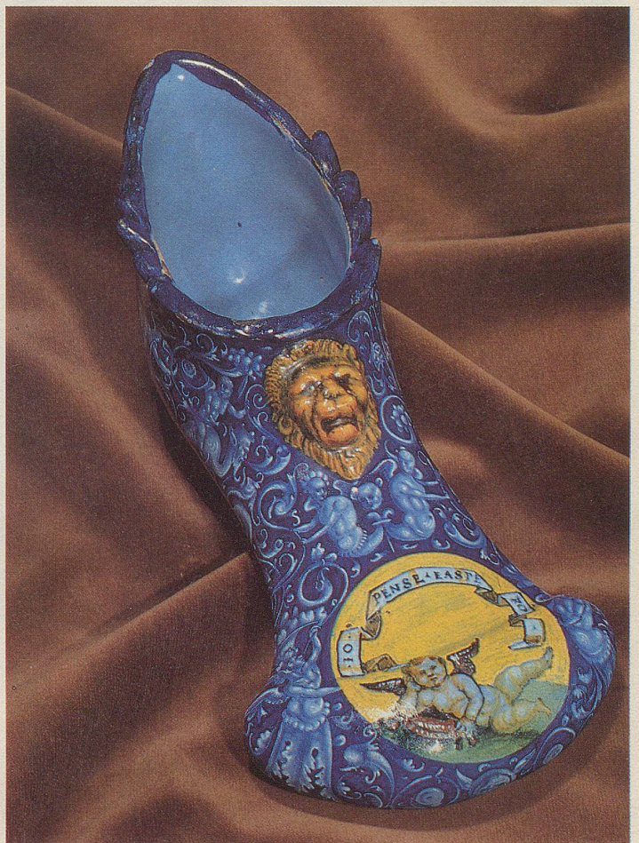
Der Kuhmaulschuh, auch Liebesbecher genannt (Faenza, um 1535).