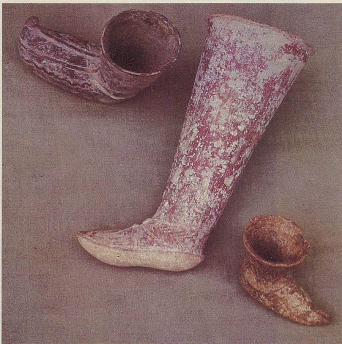
Schuh- und Stiefelgefässe aus dem alten Persien.

Nach all dem ist es nur begreiflich, dass der Schuh unter allen Kleidungsstücken besonders hochgeschätzt wurde und den hohen Rang von Göttern und Grossen dieser Erde symbolisierte. Die aus der Holz-