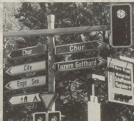
Geschafft: In der Manessestrasse vor dem Sihlhölzli geht's gleich zweimal Richtung Chur; wer auf die Autobahn zielt, der sollte hier nach rechts schwenken; die Variante 3 führt über die Seestrasse Richtung Kilchberg und weiter seeaufwärts.