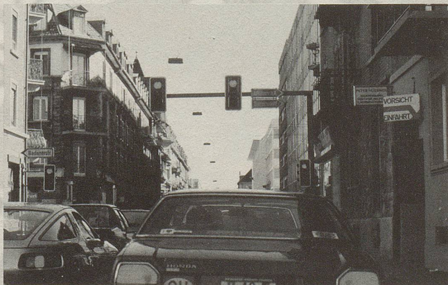
In der Weststrasse (Einbahn) gilt es auf der rechten Spur zu bleiben, um in der Manessestrasse den richtigen Rank zu erwischen. Eben jenen, der auf die N 3 führt. Übrigens: Die Häuser entlang dieser Verkehrsachse West-Ost sind (immer noch) bewohnt.