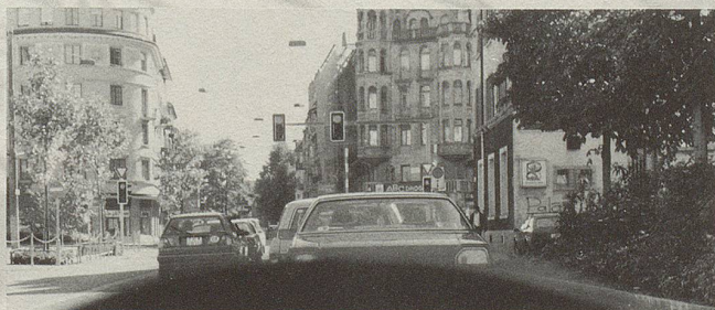
Vor der Kreuzung Sihlfeld-/Badenerstrasse, wo es vor dem Eintauchen in die Weststrasse noch fast grün aussieht.