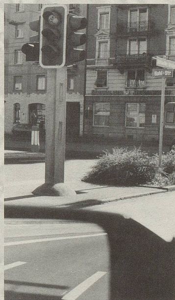
Rot vor der Hohlstrasse bei der Abfahrt von der Duttweilerbrücke und scheuer Blick aufs Restaurant Metzgerheim. Die Farbe der Liebe wird uns durch die ganze Stadt treu bleiben.