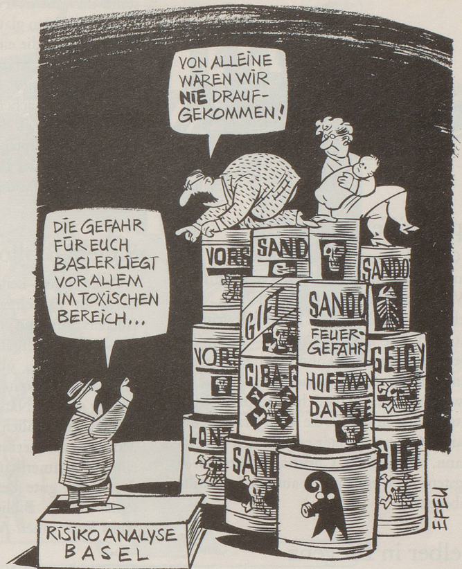
Die Risiko-Analyse über die Gefahrenbereiche in der Stadt Basel kommt zu «erstaunlichen» Resultaten.