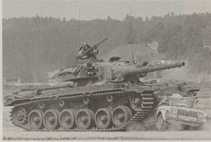
Manche Strassenbenützer beharren stur auf ihrem Vortrittsrecht ...