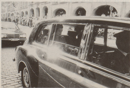
Nicht jeder Verkehrsteilnehmer wagt sich selber ans Steuer ...