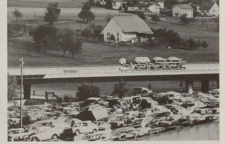
... wenn nicht gar im Auto-Himmel auf Erden gelandet ist.