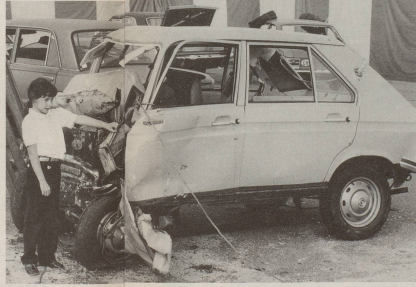
... wodurch schon geworden ...