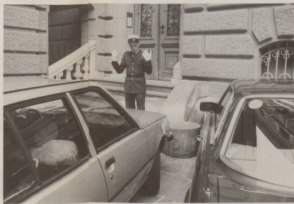
... und viele bauen in durch die Polizei ...