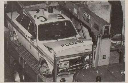
... sofern diese dazu in der Lage ist.