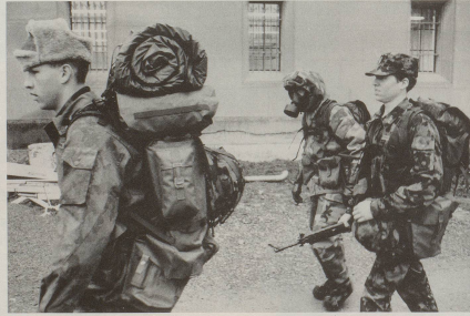
Der neue Trampler-Rucksack ermöglicht zudem endlich auch Einsätze im Ausland, ...