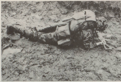
... durch den Dreck ziehen. Im Gegenteil: Wir sind überzeugt davon, ...