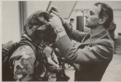
Alles in allem: ein Segen.