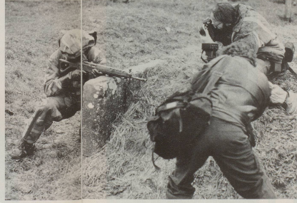
... während die beeindruckten.