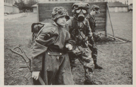
Oberstes Gebot bleibt allerdings einheitliche, korrekte Kleidung.