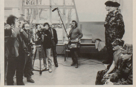
Übrigens: Diese Angaben sind streng vertraulich. Der Gegner darf nichts erfahren.