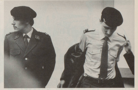
... das Verkleiden als Pösterler jeden Gegner vollständig verwirren wird.