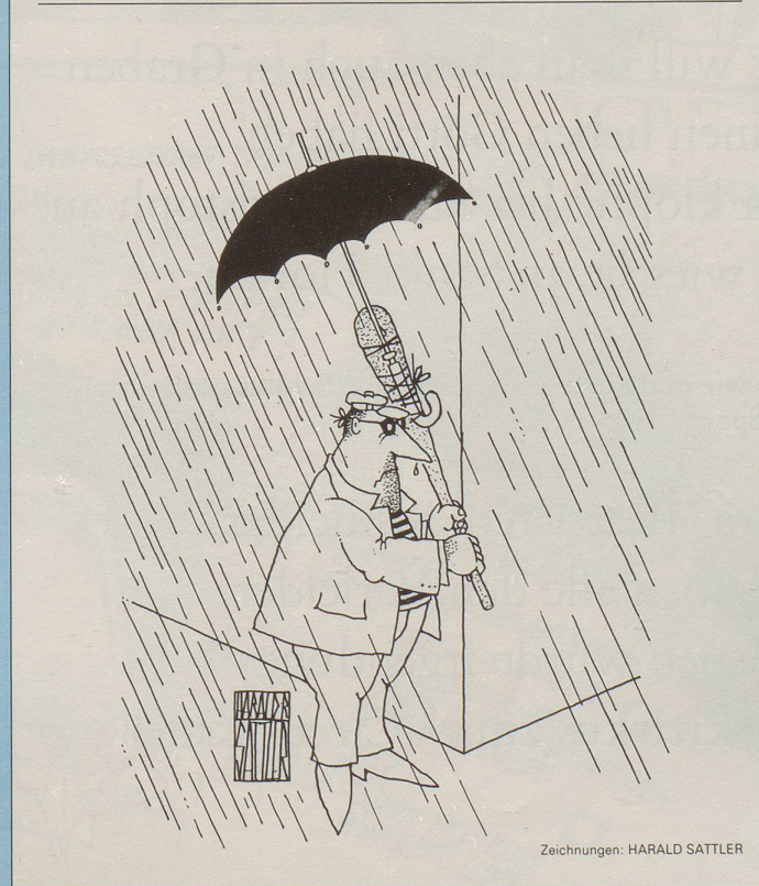
Zeichnungen: HARALD SATTLER

«Chef, wenn ich kündige, verlieren Sie einen Ihrer besten Mitarbeiter!» «Wer geht denn noch mit Ihnen?»