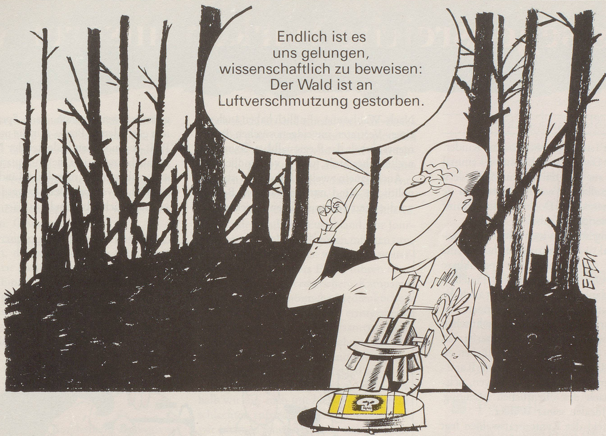
Ein jahrelanges Forschungsprogramm erhärtet die Vermutung, die Luftverschmutzung mache den Wald krank. Aber bewiesen ist damit natürlich noch nichts!