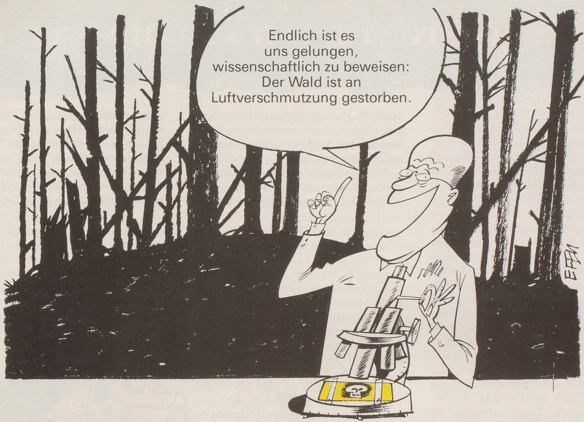
Ein jahrelanges Forschungsprogramm erhärtet die Vermutung, die Luftverschmutzung mache den Wald krank. Aber bewiesen ist damit natürlich noch nichts!