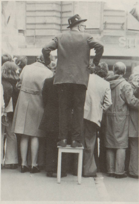
1 Dabeisein ist alles! Ob in Bern, ...