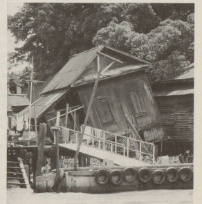
4 Unser Weltbild verdanken wir darum ...