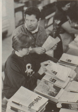
6 Tragen wir also Sorge ...