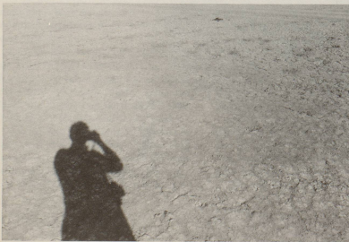
5 ... fast ausschliesslich den Medien. 36