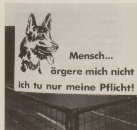
7 ... zum Wächteramt ...