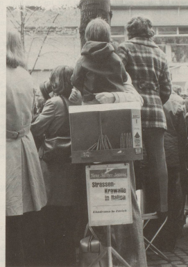
3 Doch die Logenplätze sind leider meist belegt.