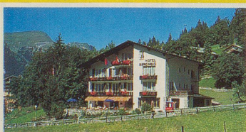
HOTEL BERGHAUS * * * * CH-3823 WENGEN Fam. A.W. Fontana-Fuchs, Tel. 036 / 55 21 51

... finden Sie etwas oberhalb des Dorfes in ruhiger, sonniger, unverbaute Lage, Nähe Schwimmbad.