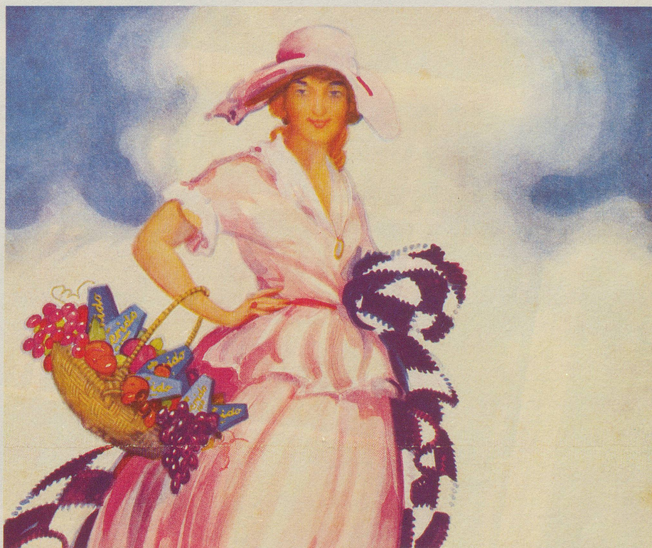
Immer wieder verblüffte die schweizerische Schokoladenindustrie durch künstlerisch interessante Grafiken: Das Plakat mit der Toblerido-Dame entstand um 1925.