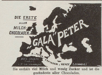
Generalvertretung für Deutschland: Otto & Quantz, Frankfurt a. Main.