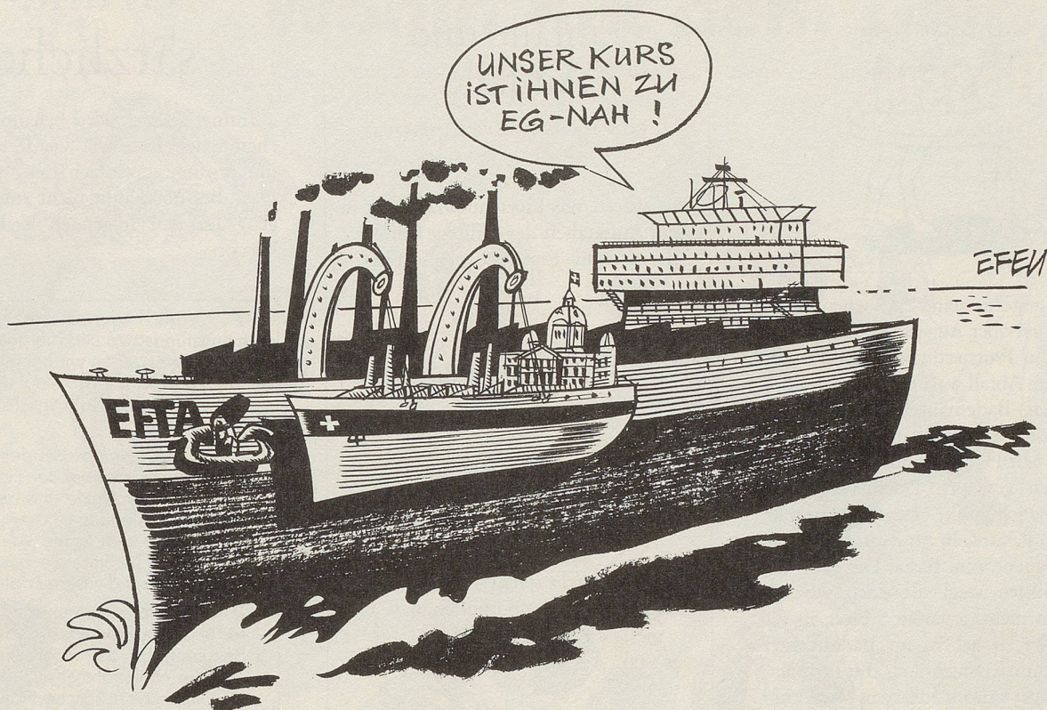
EG-EFTA-Schweiz: Bootet sich die Schweiz selbst aus?