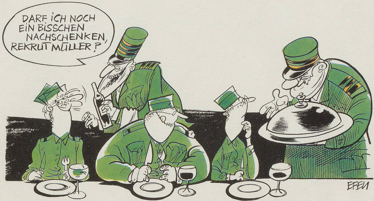
In den Sommerrekrutenschulen, die eben begonnen haben, ist dem Vernehmen nach im Hinblick auf die Armeeabschaffungs-Initiative das «Betriebsklima» stark verbessert worden.